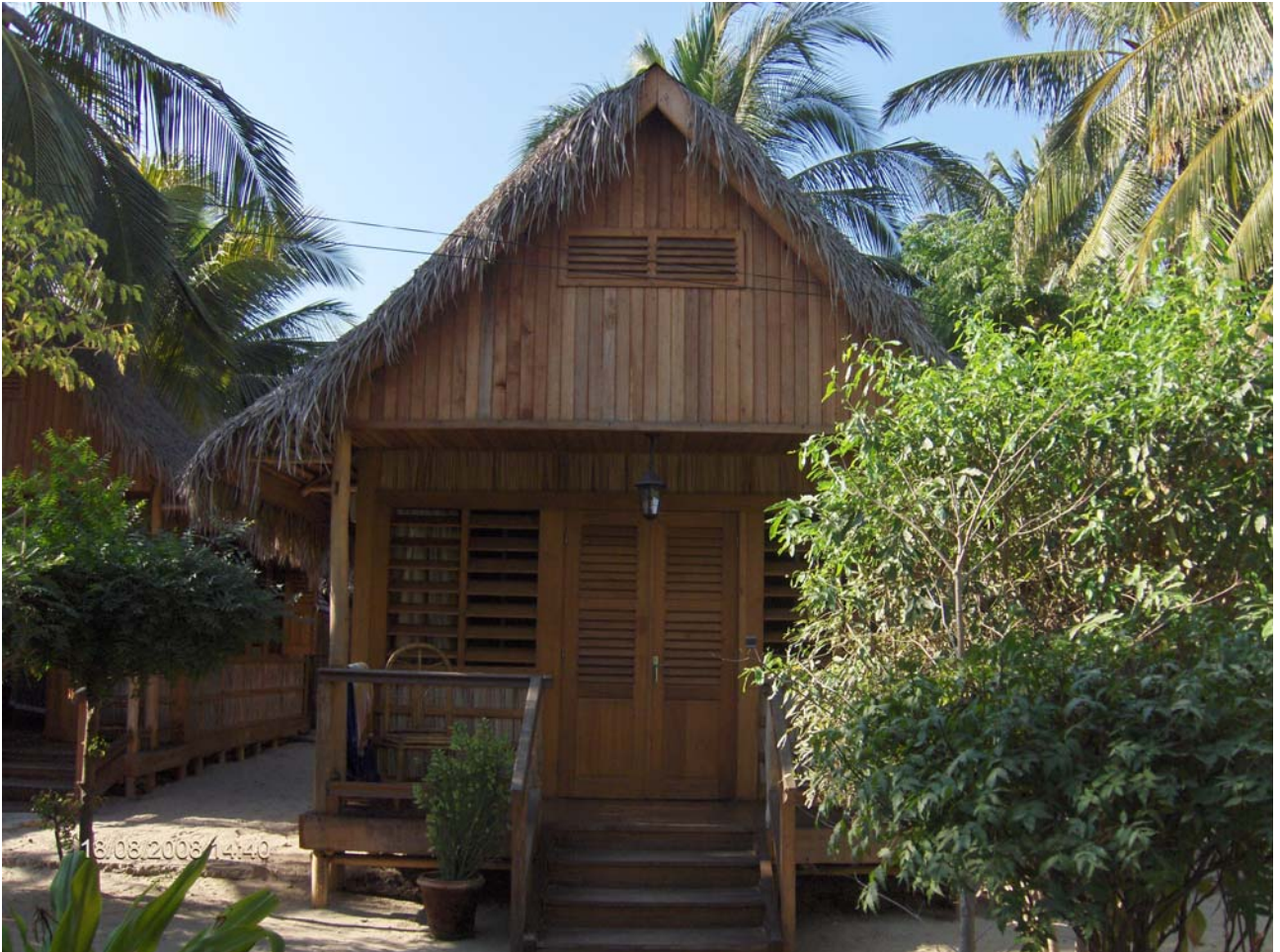
Hotel "Chez Maggie" a Morondava