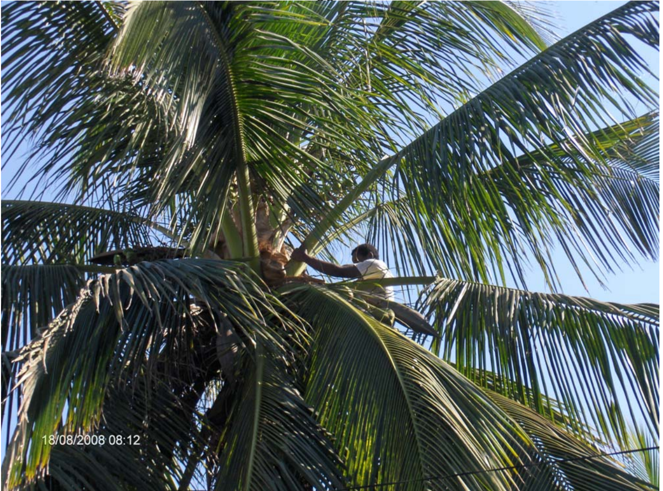
Pianta di cocco nel giardino dell'hotel "Chez Maggie" a Morondava

Foto scattate durante la mia vacanza in Madagascar nell'agosto 2008