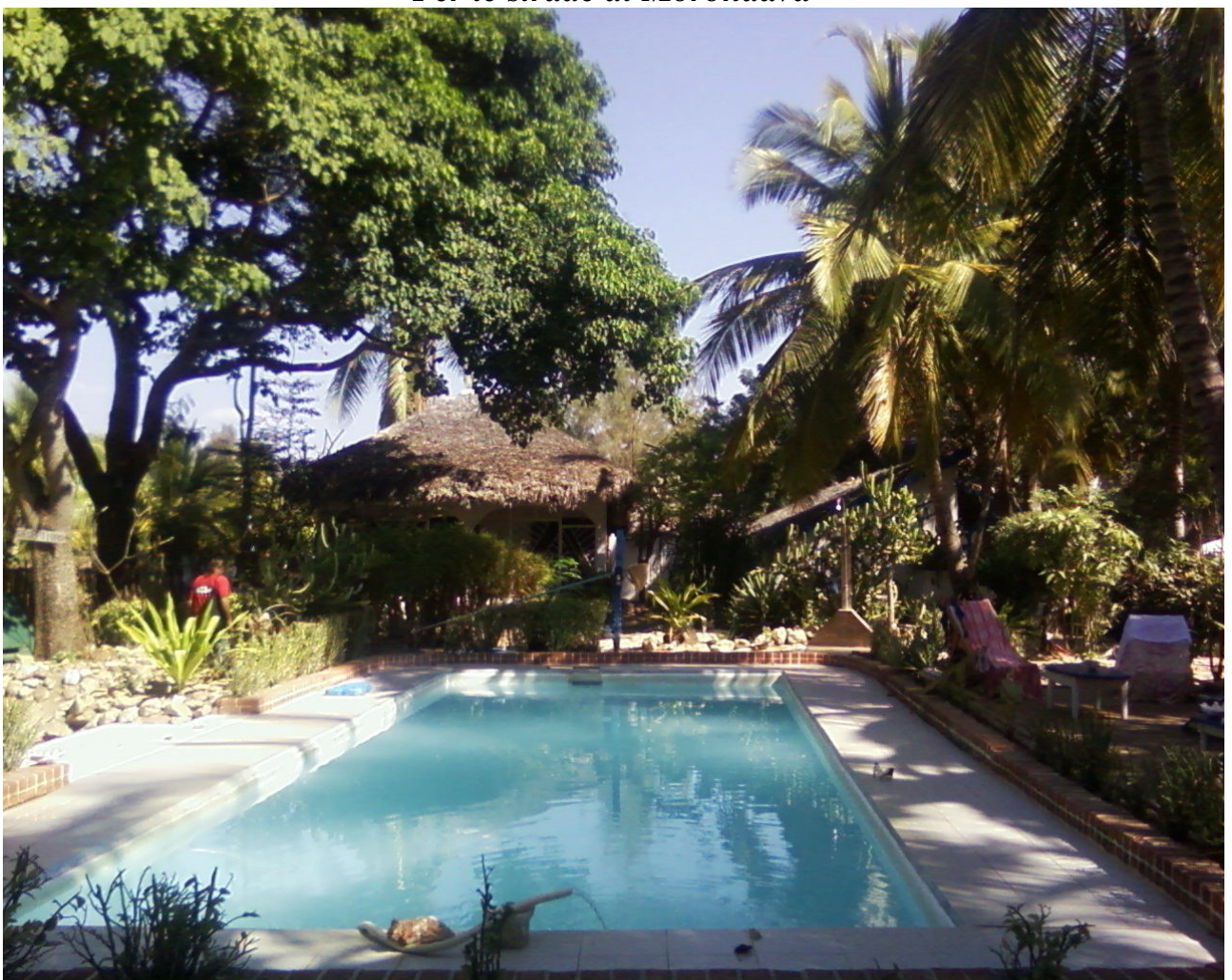
Piscina Hotel "Chez Maggie" a Morondava

Foto scattate durante la mia vacanza in Madagascar nell'agosto 2008