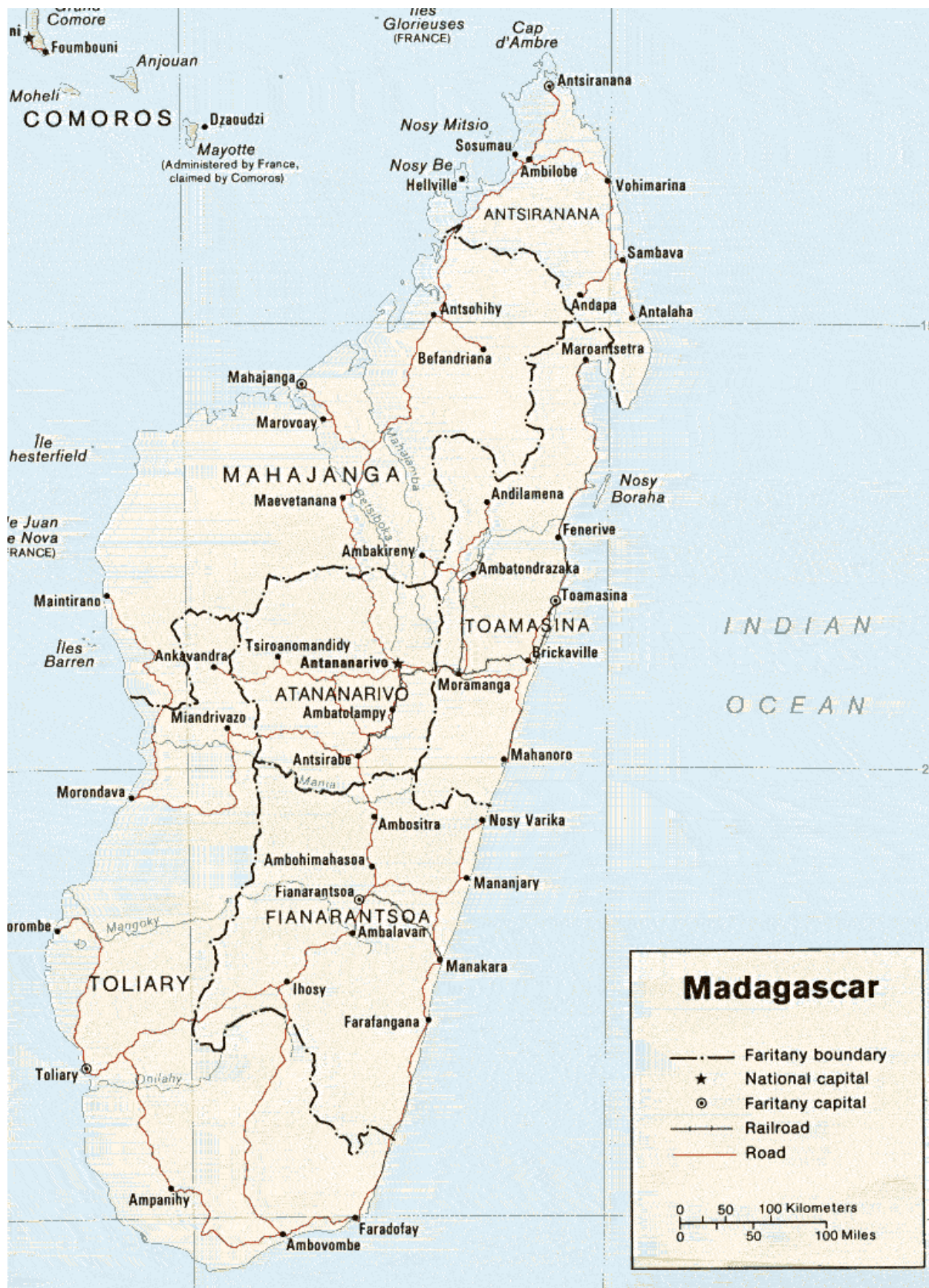
Foto scattate durante la mia vacanza in Madagascar nell'agosto 2008