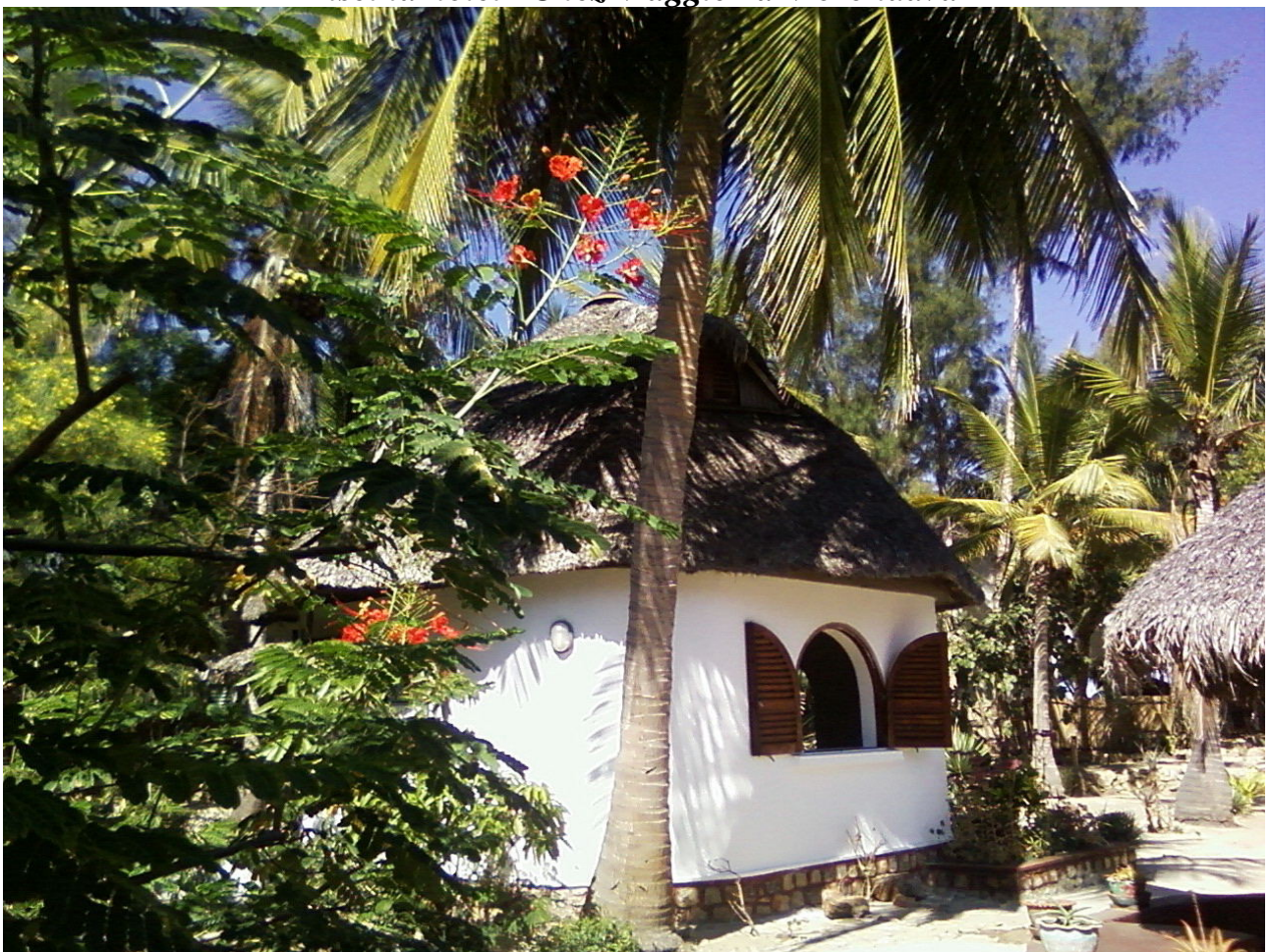
Hotel "Chez Maggie" a Morondava

Foto scattate durante la mia vacanza in Madagascar nell'agosto 2008