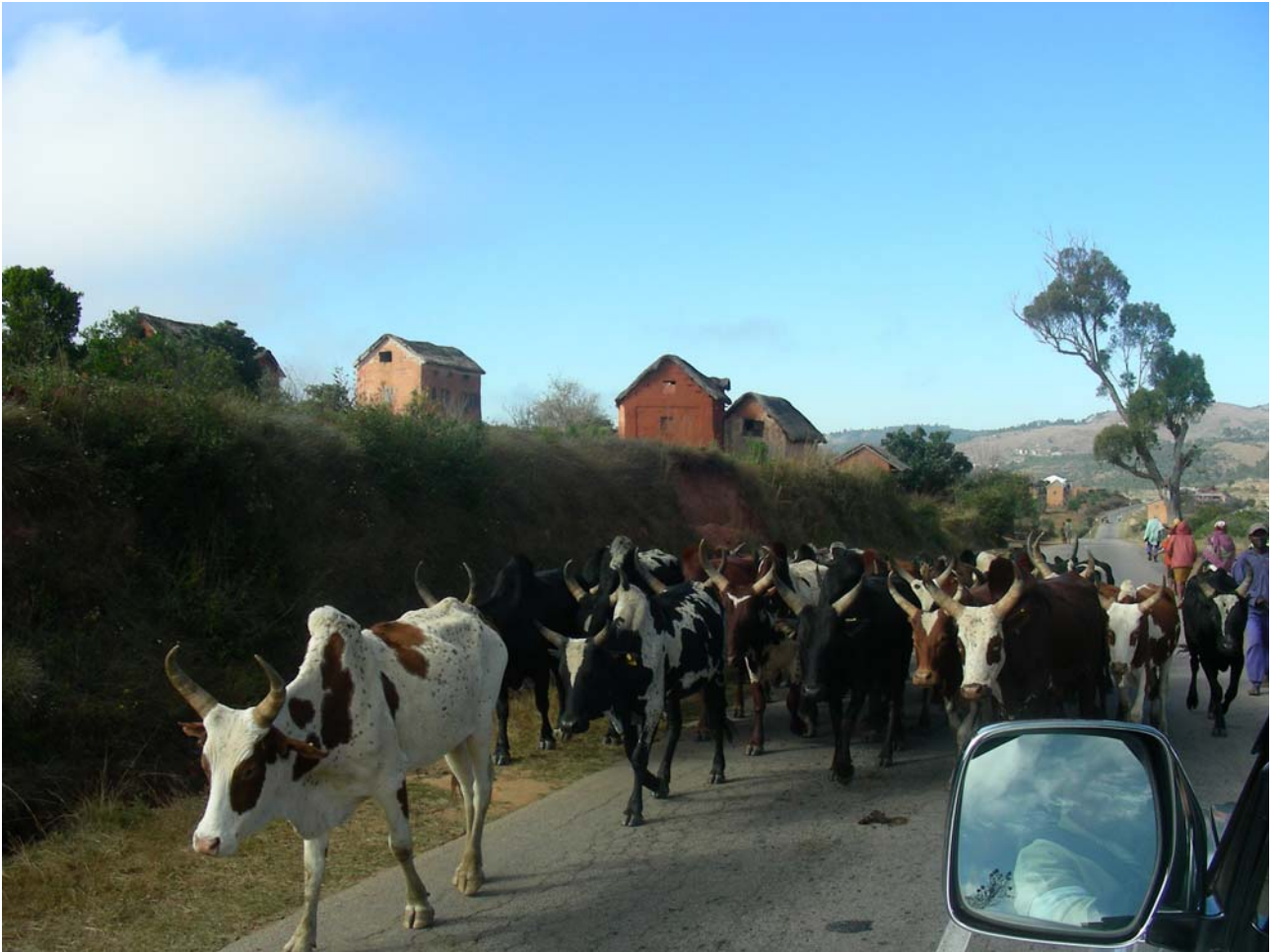
Mandrie di zebù pezzati e neri