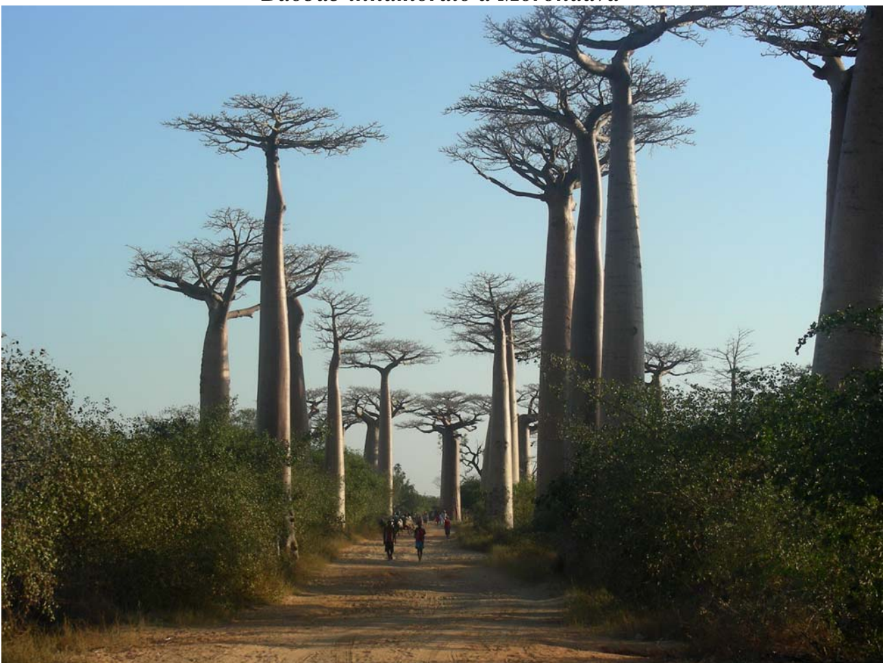
Viale dei baobab a Morondava

Foto scattate durante la mia vacanza in Madagascar nell'agosto 2008 (Wanda Allievi)