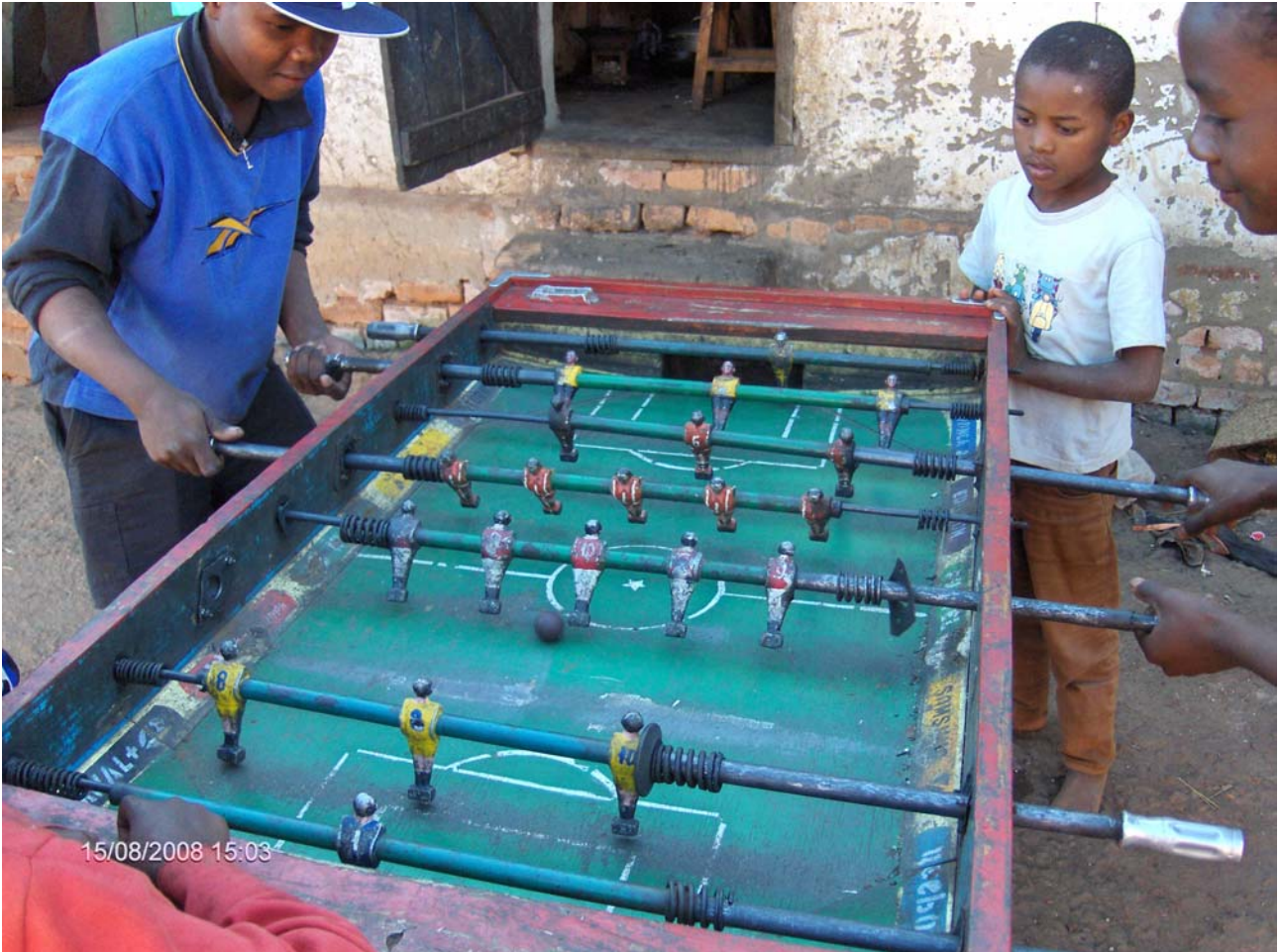
Foto scattate durante la mia vacanza in Madagascar nell'agosto 2008