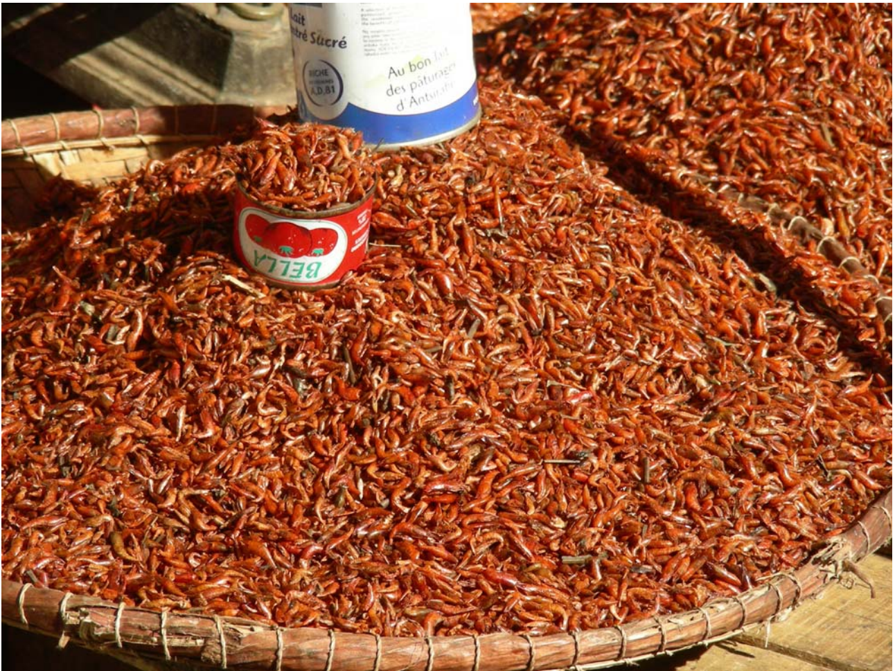
Mercato di Antananarivo