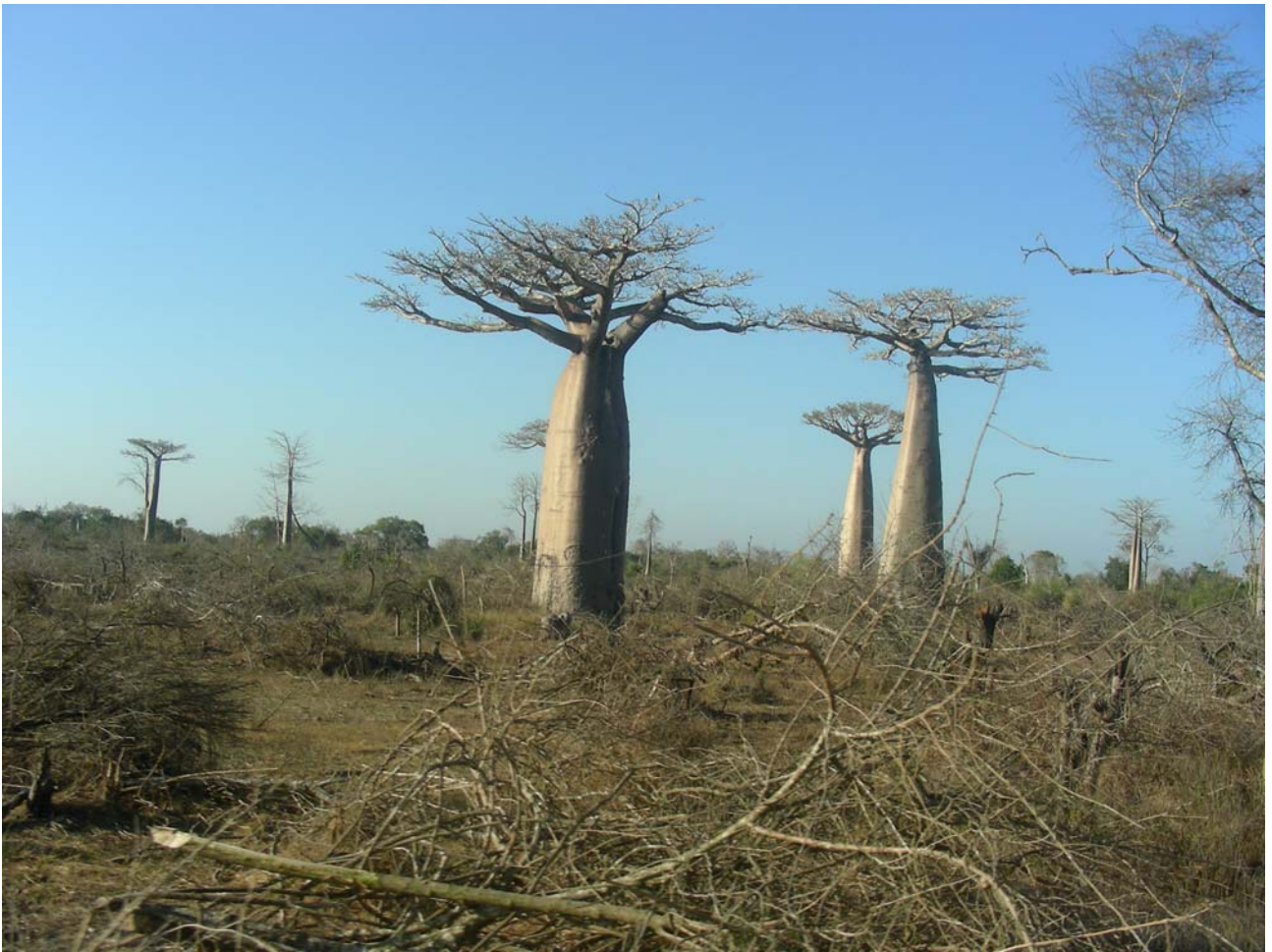
Baobab a Morondava