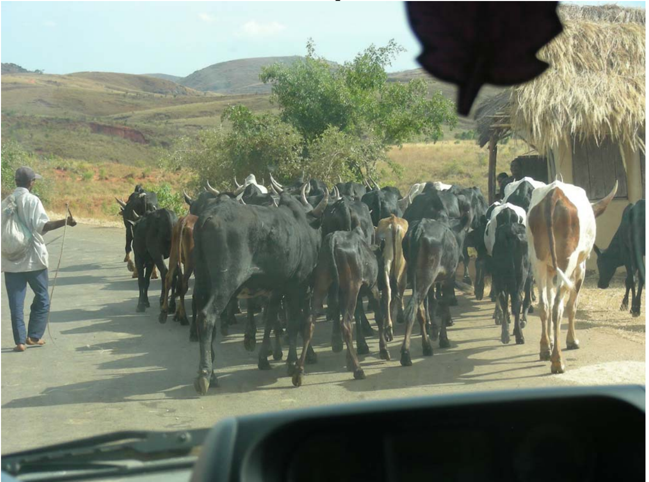
Foto scattate durante la mia vacanza in Madagascar nell'agosto 2008