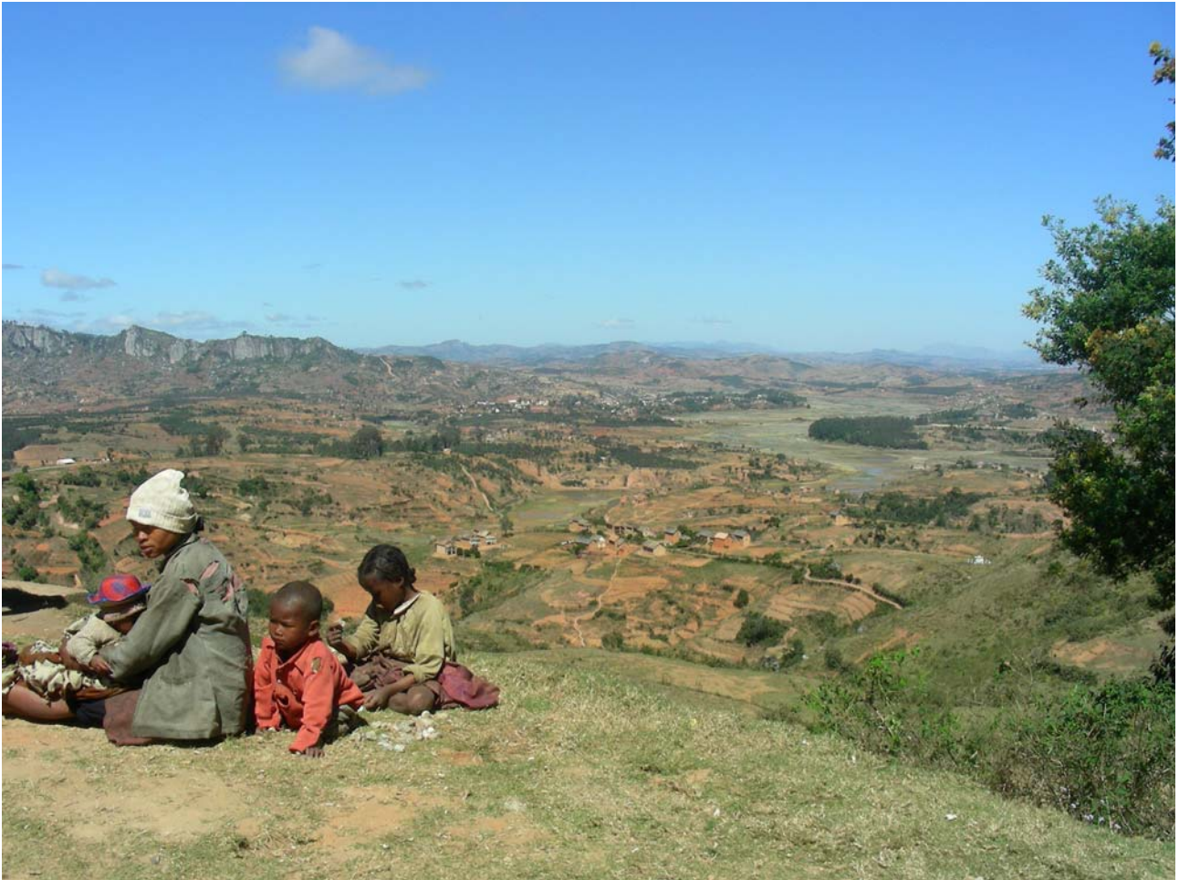
Paesaggio interno del Madagascar a sud di Ambositra