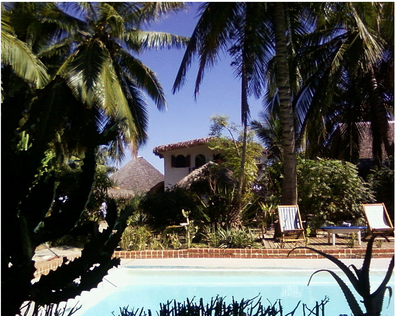
Piscina hotel "Chez Maggie" a Morondava