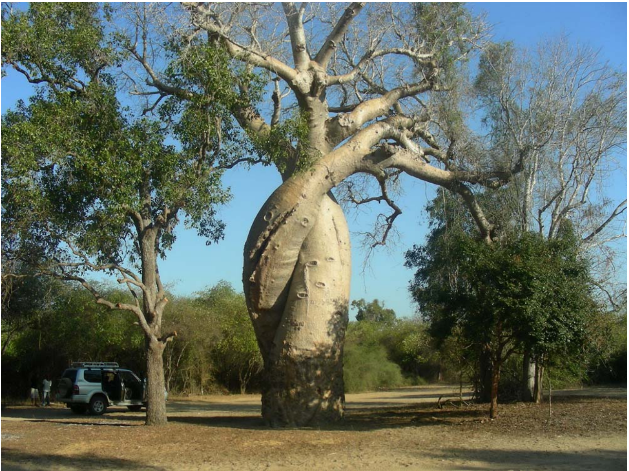
Baobab innamorato a Morondava