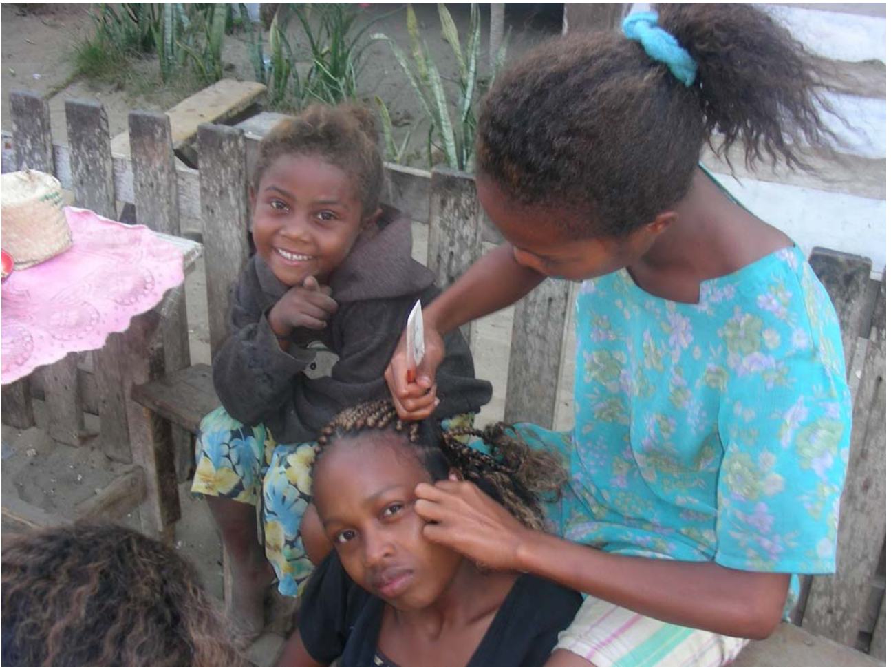
Per le strade di Morondava